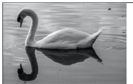
Titre ou numero de la Photo Saturnin