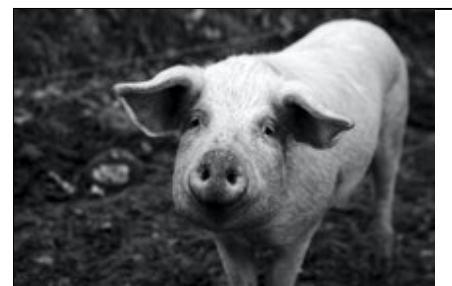
Titre ou numero de la Photo Le Cochon