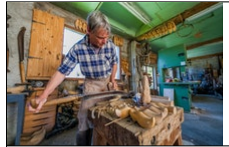
Titre ou numero de la Photo Le Sabotier