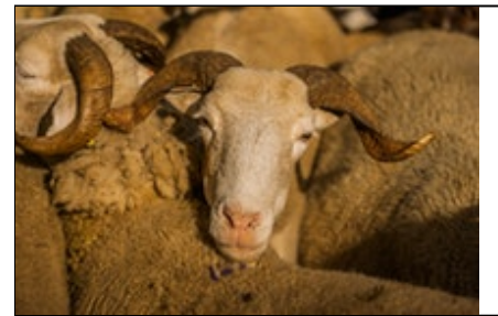
Titre ou numero de la Photo Hermés