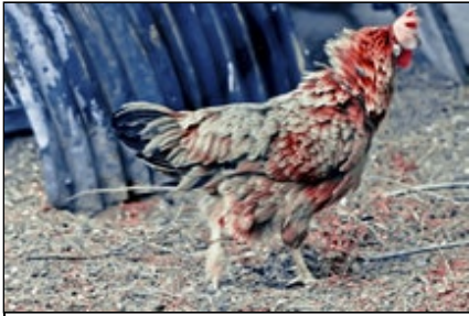
Titre ou numero de la Photo La Poule