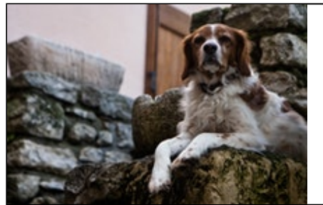
Titre ou numero de la Photo Le gardien