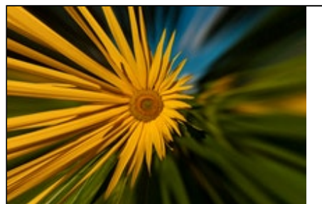
Titre ou numero de la Photo Plexus