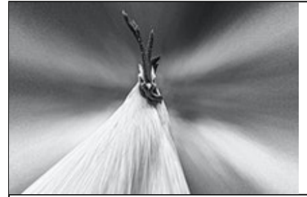
Titre ou numero de la Photo Le Coq