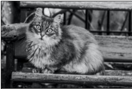
Titre ou numero de la Photo Caline