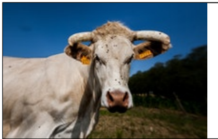
Titre ou numero de la Photo Marguerite

Connectez-vous sur prixhbc.awardsplatform.com pour voir toutes les candidature pièces jointes.