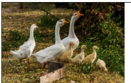
Titre ou numero de la Photo La famille Oie