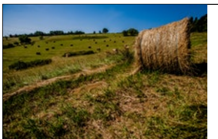
Titre ou numero de la Photo Terre Basse